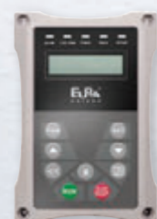
CLAVIER À DISTANCE LCD IP66